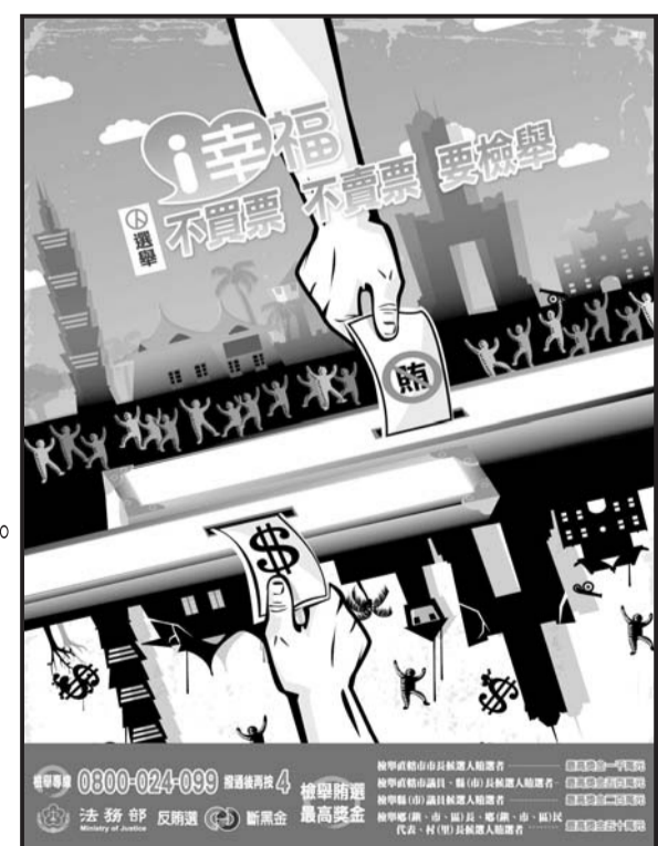
檢舉鄉長、鄉民代表、村長候選人賄選者，最高獎金五十萬元。