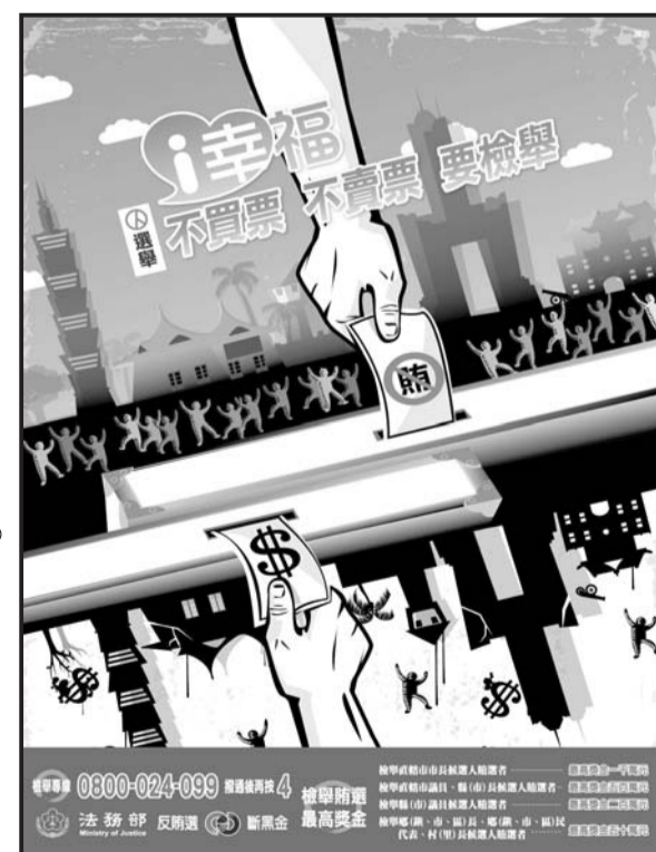
檢舉鄉長、鄉民代表、村長候選人賄選者，最高獎金五十萬元。