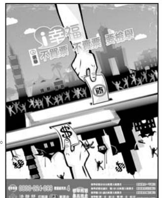
檢舉鄉長、鄉民代表、村長候選人賄選者，最高獎金五十萬元。