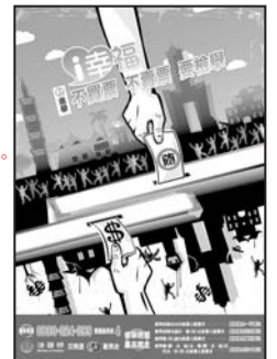
檢舉鄉長、鄉民代表、村長候選人賄選者，最高獎金五十萬元。