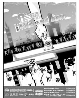
檢舉鄉長、鄉民代表、村長候選人賄選者，最高獎金五十萬元。