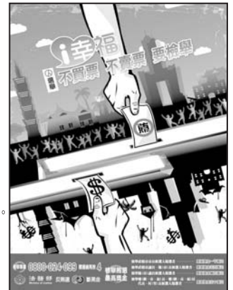
檢舉鄉長、鄉民代表、村長候選人賄選者，最高獎金五十萬元。