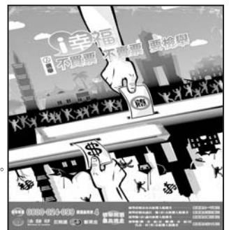
檢舉鄉長、鄉民代表、村長候選人賄選者，最高獎金五十萬元。