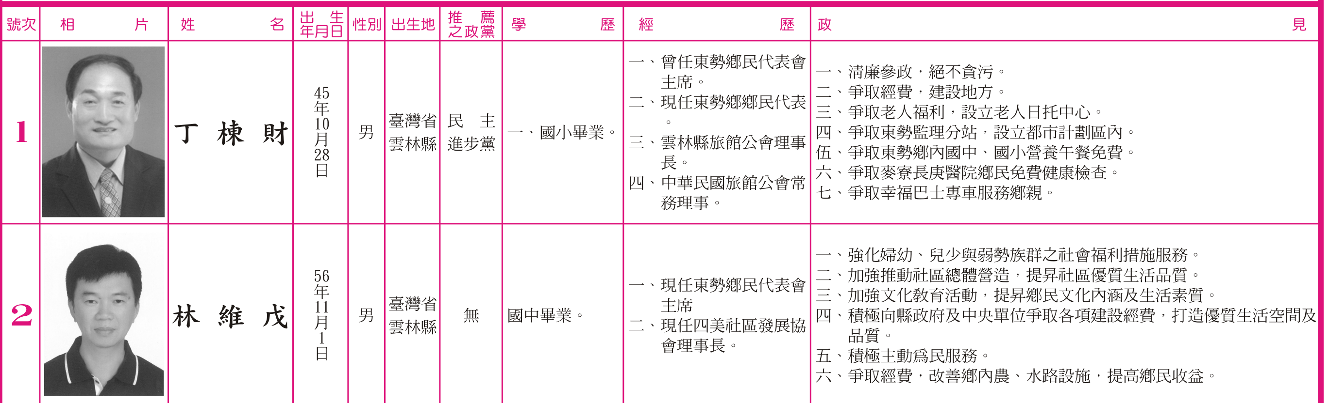
103年地方公職人員選舉雲林縣東勢鄉投(開)票所一覽表

臺灣省雲林縣東勢鄉第17屆鄉長選舉，經定於中華民國103年11月29日（星期六）上午8時起至下午4時止舉行投票。茲依公職人員選舉罷免法第47條規定，將候選人所填之政見及個人資料刊登如下，候選人個人資料係依據候選人所填列資料刊登，如有不實，由候選人自行負責。