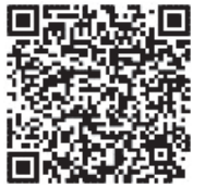
衛生福利部疾病管制署