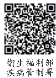
衛生福利部 疾病管制署