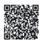
衛生福利部疾病管制署