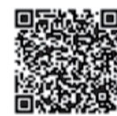
衛生福利部疾病管制署