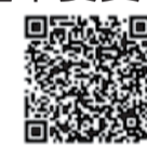
衛生福利部疾病管制署