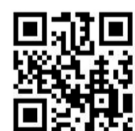
衛生福利部疾病管制署

2. 嚴重特殊傳染性肺炎防疫規定及選務防疫措施，請參見衛生福利部疾病管制署網站(https://www.cdc.gov.tw)及中央選舉委員會網站(https://www.cec.gov.tw)。