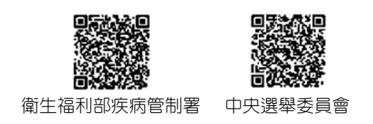
衛生福利部疾病管制署 中央選舉委員會