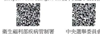
衛生福利部疾病管制署 中央選舉委員會