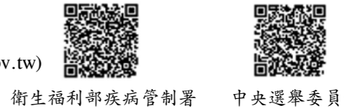
衛生福利部疾病管制署 中央選舉委員會