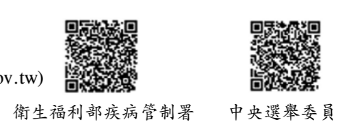
衛生福利部疾病管制署 中央選舉委員會