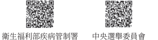
衛生福利部疾病管制署 中央選舉委員會