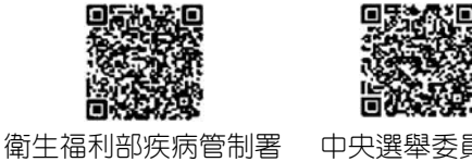
衛生福利部疾病管制署 中央選舉委員會

十、其他： 公職人員選舉罷免法第 29 條第 1 項候選人名單公告後，經發現候選人在公告前或投票前有下列情事之一者，投票前由選舉委員會撤銷其候選人登記；當選後依第 121 條規定提起當選無效之訴： 1.候選人資格不合第 24 條第 1 項至第 3 項規定。 2.有第 26 條或第 27 條第 1 項、第 3 項之情事。 3.依第 92 條第 1 項規定不得登記為候選人。