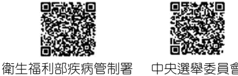
衛生福利部疾病管制署 中央選舉委員會

十、其他： 公職人員選舉罷免法第 29 條第 1 項候選人名單公告後，經發現候選人在公告前或投票前有下列情事之一者，投票前由選舉委員會撤銷其候選人登記；當選後依第 121 條規定提起當選無效之訴： 1.候選人資格不合第 24 條第 1 項至第 3 項規定。 2.有第 26 條或第 27 條第 1 項、第 3 項之情事。 3.依第 92 條第 1 項規定不得登記為候選人。