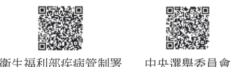
衛生福利部疾病管制署 中央選舉委員會