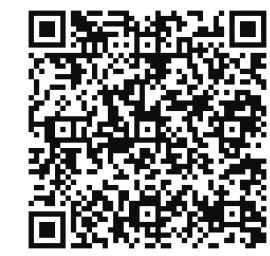
衛生福利部疾病管制署