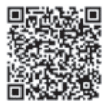
衛生福利部疾病管制署