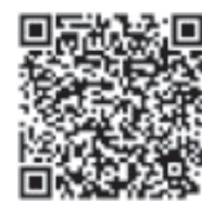
衛生福利部疾病管制署