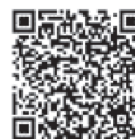
衛生福利部疾病管制署