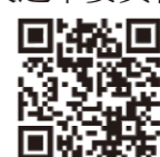
衛生福利部疾病管制署

衛生福利部疾病管制署網站( https://www.cdc.gov.tw )及中央選舉委員會網站( https://www.cec.gov.tw )。