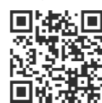
衛生福利部疾病管制署

衛生福利部疾病管制署網站( https://www.cdc.gov.tw )及中央選舉委員會網站( https://www.cec.gov.tw )。