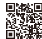
衛生福利部疾病管制署