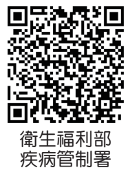
衛生福利部 疾病管制署